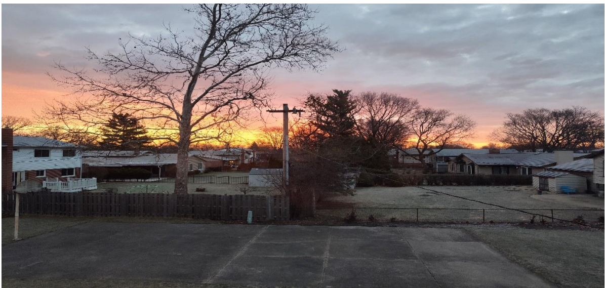
4・1アーリントンハイツの朝