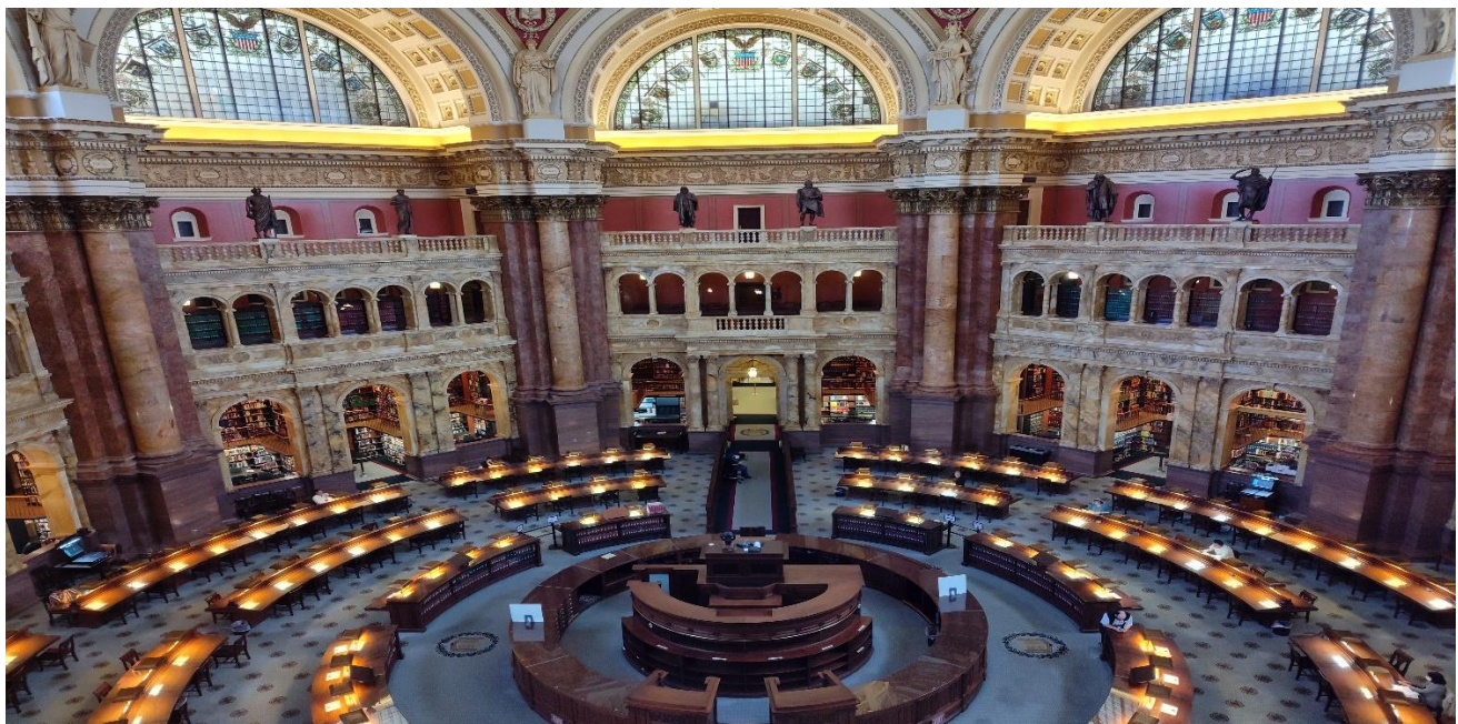
ワシントン DC 国立国会図書館 閲覧室内 (国会議事堂前にあります)